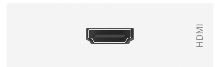
Modulo HDMI TC3