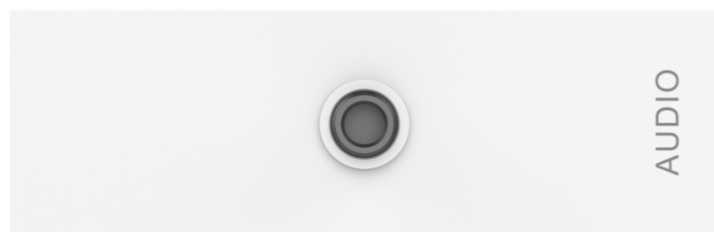
Modulo mini-jack TC3