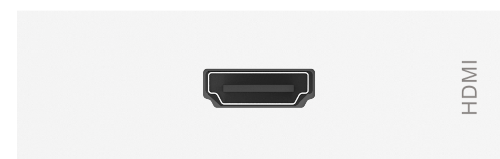
TC3 Módulo HDMI