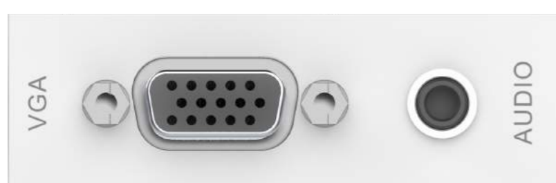
Module VGA et audio TC3