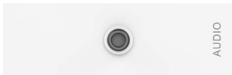
Module minijack TC3 (Euroblock à l'arrière)