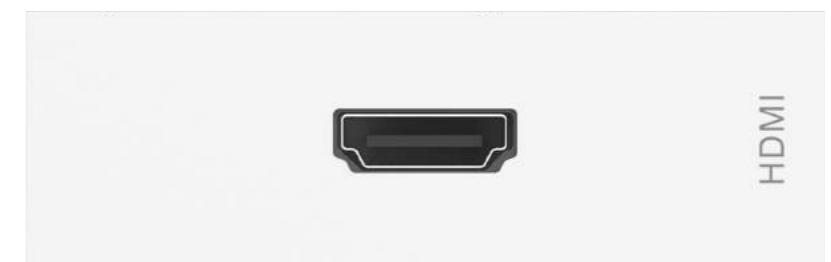
Module HDMI TC3