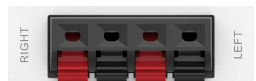
Module haut-parleur à fil nu et à 4 ports TC3